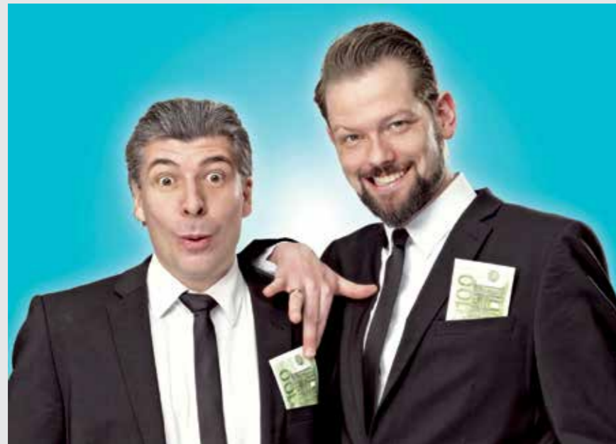
Das Kabarettisten-Duo „Onkel Fisch“ kennt sich mit Konzernkritik aus.